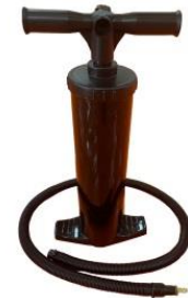
Doppelhubkolbenpumpe zum Befüllen des Schwimmwulstes als Zubehör erhältlich