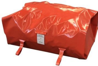
verpackt in Packtasche mit Trageschlaufen