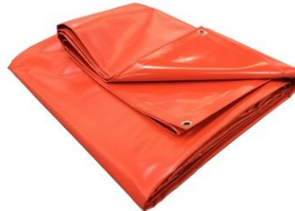
Unterlegplane als Zubehör erhältlich